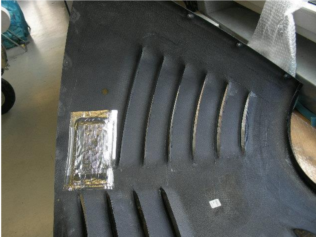
Abb. 1 – Montierter Hitzeschutz Motorhaube