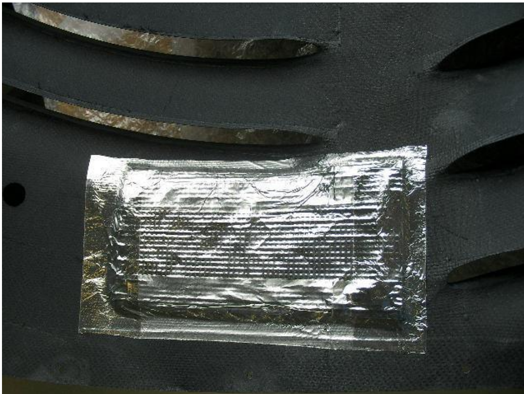
Abb. 2 – Montierter Hitzeschutz Motorhaube